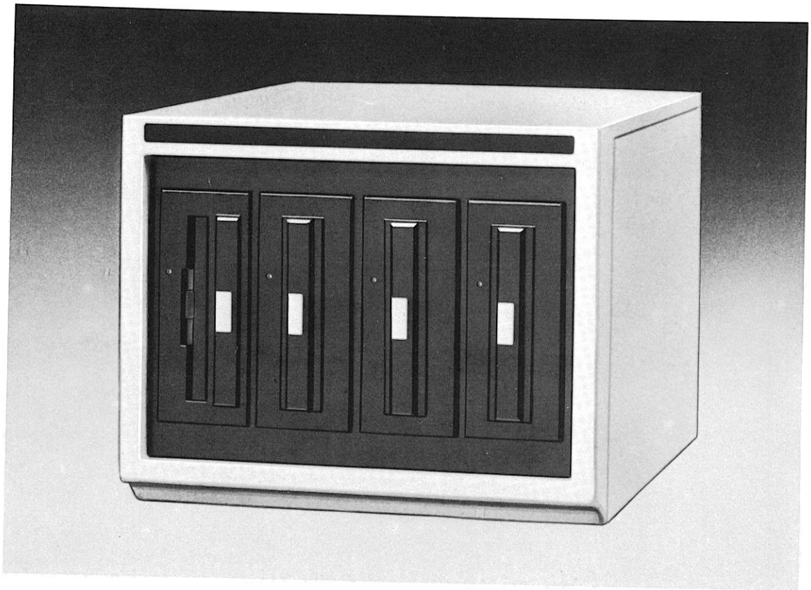
Abb. 2 Floppy-Disk-Einheit mit 4 Laufwerken